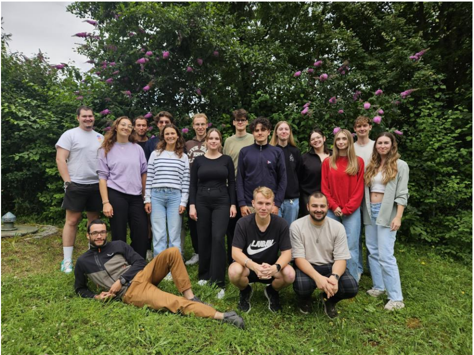
Eure Fachschaft WiWi

Wir wünschen euch einen guten Start ins Studium.